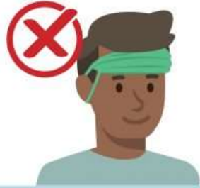
On your forehead