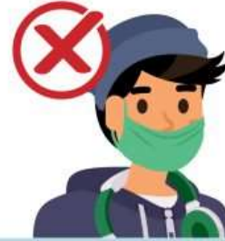
Under your nose