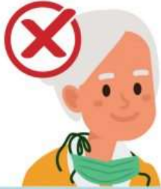
Around your neck