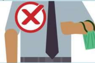
On your arm