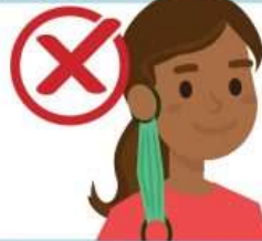
Dangling from one ear