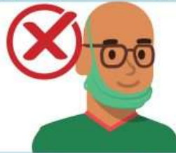
On your chin